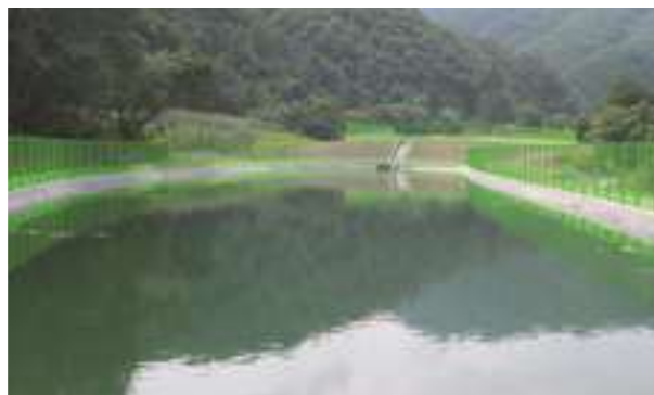
2007 - Daemyung Vivaldi Park - Jižní Korea - 8.000 m 2