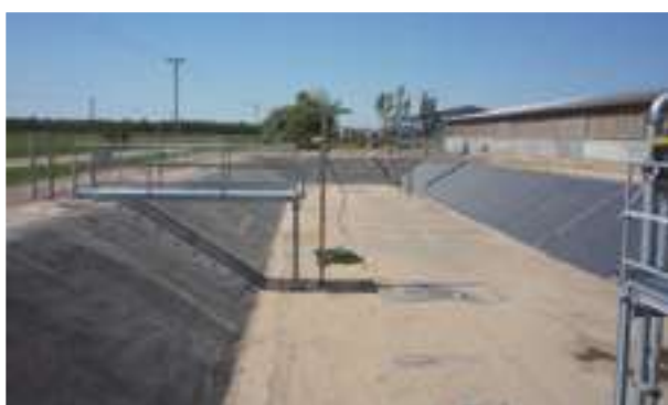
2008 - Solum - Maďarsko - 1.200 m 2