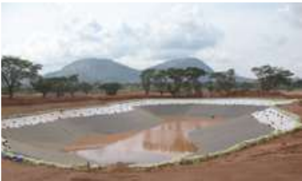
2009 - Prestige Golf & Country - Indie - 145.000 m 2