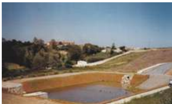
1994 - Storm Water Reservoir - Francie - 55.000 m 2