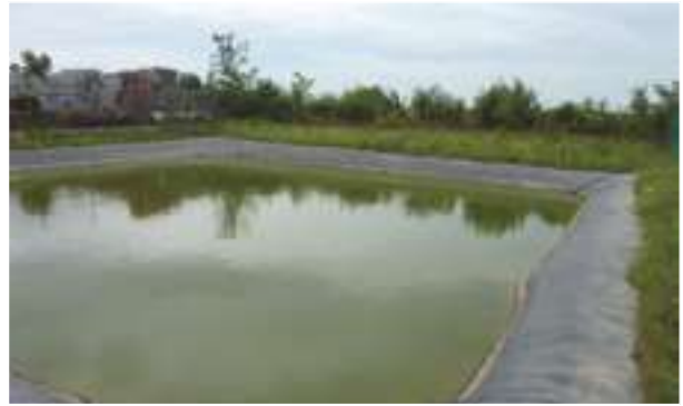
2007 - Hernadnemeti - Maďarsko - 585 m 2