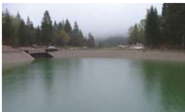
2002 - Monte Bondone - Itálie - 14.000 m 2