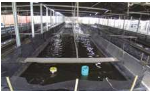
2005 - Texas Park & Wild Life - USA - 456.000 m 2 (95 nádrží)