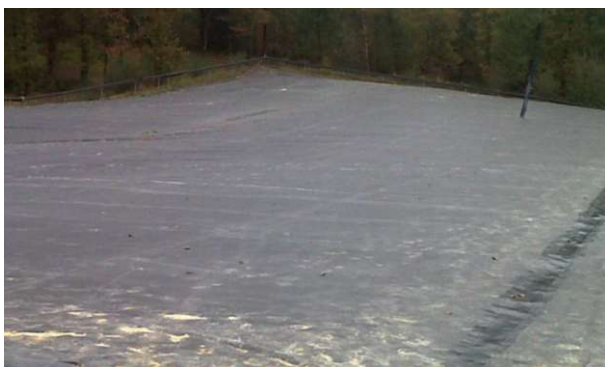
2011 - Gueltas - Francie - 76.300 m 2