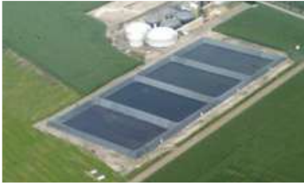
2009 - Wilbertoord - Nizozemí - 25.000 m 2