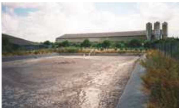
1994 - Francie - 1.200 m 2