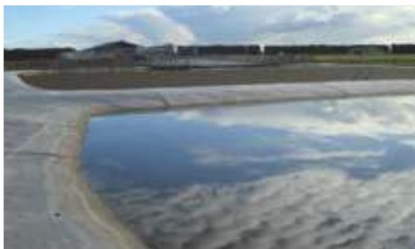
2008 - Ormsbyz - Nový Zéland - 4.474 m 2