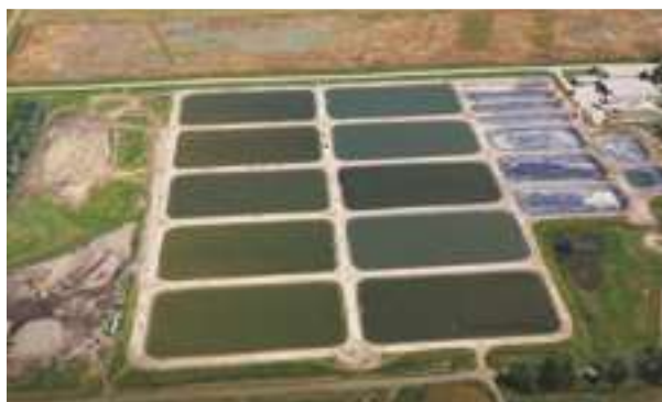
2007 - Blue Dog State Fish Hatchery - USA - 116.000 m 2 (19 nádrží)