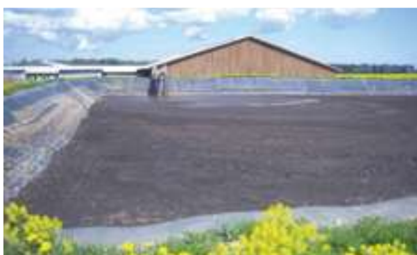
2005 - Estonsko - 4.000 m 2