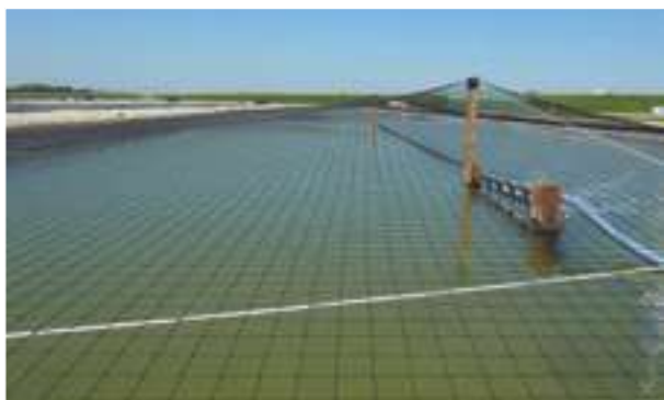
2010 - Aquacultuur Oostzeedijk - Nizozemí - 30.000 m 2 (12 nádrží)