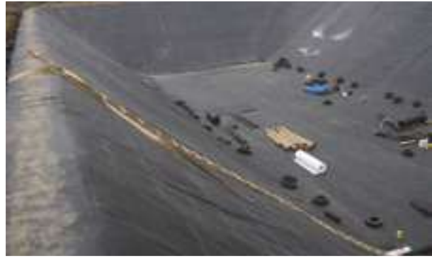
2005 - Berg - Rakousko - 10.000 m 2