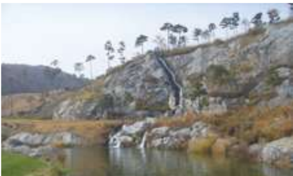
2001 - Golf Pond Rexfield - Jižní Korea - 50.000 m 2