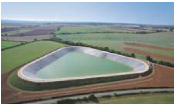
2008 - Les Groies Lorin - Francie - 27.000 m 2