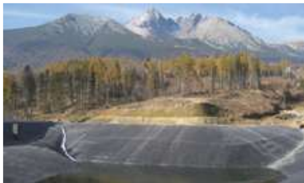
2010 / 2008 - Vysoké Tatry - Slovensko - 30.000 m 2