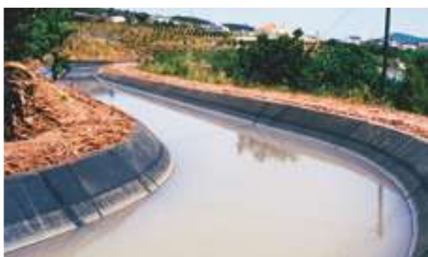
2000 - Silves - Portugalsko - 3 km