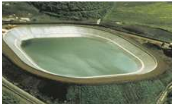
1991 - El Boqueron - Španělsko - 11.500 m 2