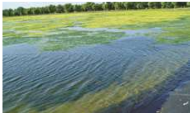
1992 - Vérinnes - Francie - 9.300 m 2