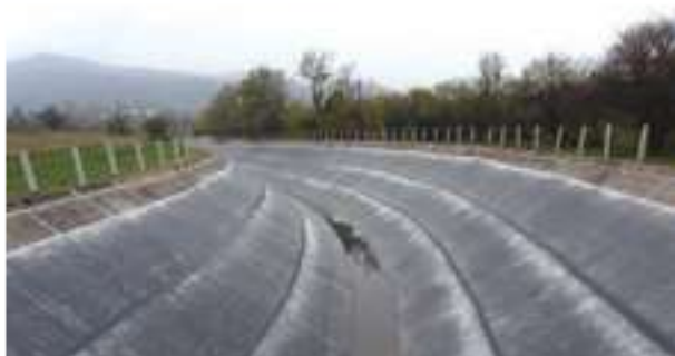
2006 / 2008 / 2010 - Vlasinske Hidroelektrane - Srbsko - 0.8 km