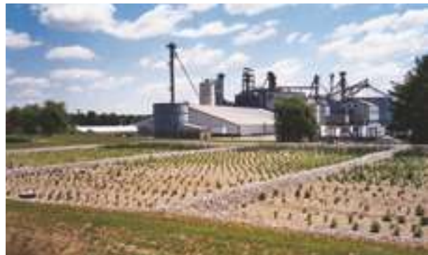
2004 - Rose Acres Farm - USA - 7.100 m 2

Firestone BUILDING PRODUCTS NOBODY COVERS YOU BETTER.®