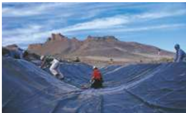
2001 - Tulelake Irrigation District - USA - 3.7 km