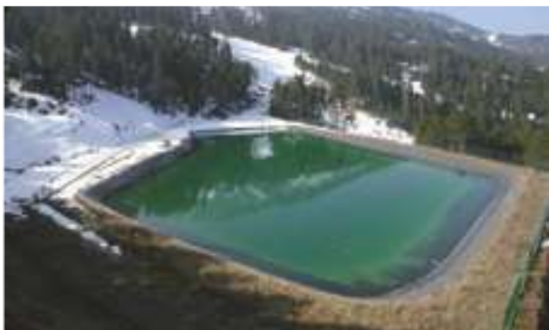
2002 - Cerdanya - Španělsko - 12.000 m 2