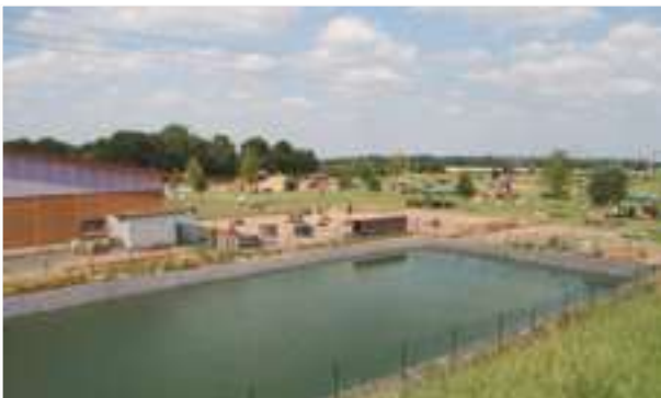
2007 - Bubenheimer Spieleland - Německo - 2.000 m 2