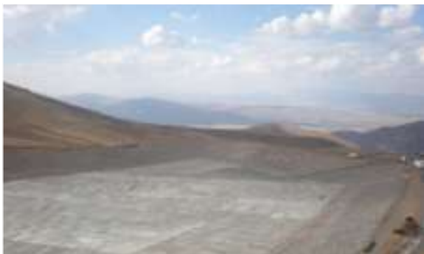
2010 - Konaklı - Turecko - 34.680 m 2