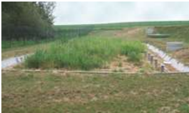
2007 - Puymaufrais - Francie - 1.500 m 2