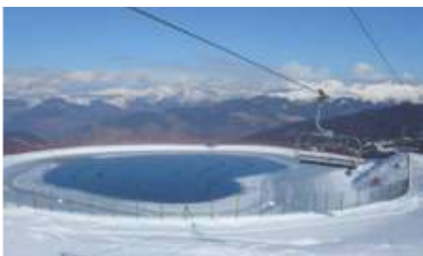
2006 - Meribel - Francie - 30.800 m 2