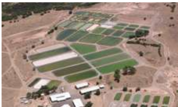
2006 - Dexter National Fish Hatchery - USA - 23.000 m 2 (25 nádrží)