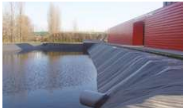
2006 - Belgie - 1.500 m 2