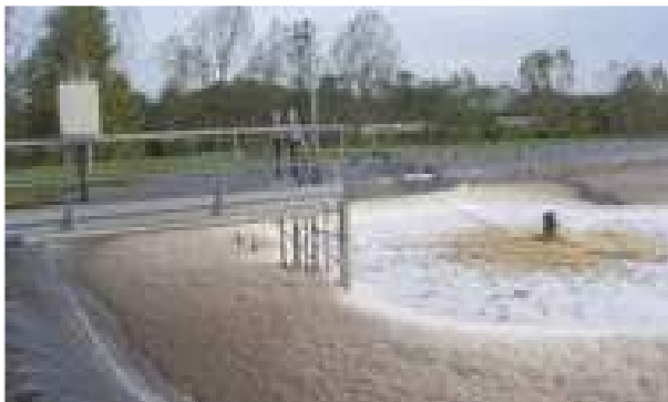
2001 - Castillon - Francie - 10.000 m 2