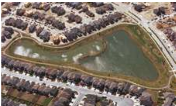
2006 - Cranston - Kanada - 21.500 m 2