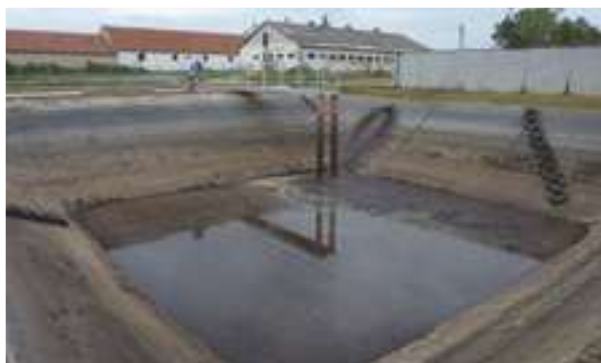
2008 - Hernadnemeti - Maďarsko - 2.000 m 2