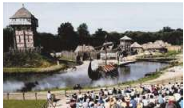
1996 - Puy du Fou - Francie - 8.300 m 2