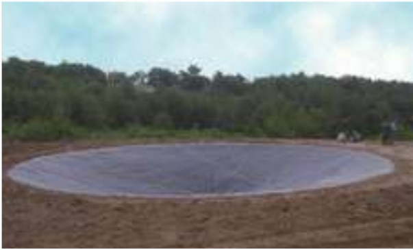
2010 - Adana - Turecko - 17.000 m 2