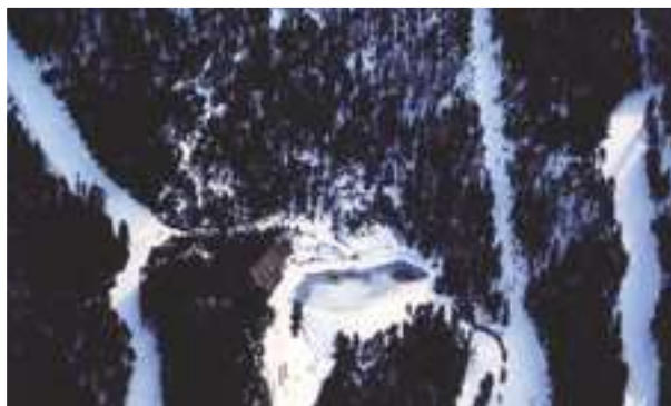
1994 - La Masella - Španělsko - 7.000 m 2