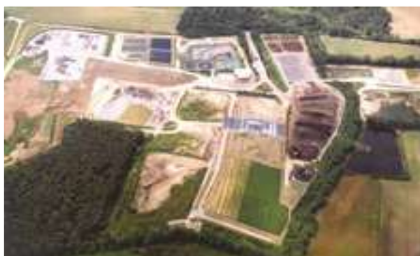
2000 / 2008 - Pont Scorff - Francie - 60.000 m 2