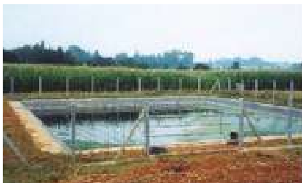
1993 - Francie - 500 m 2