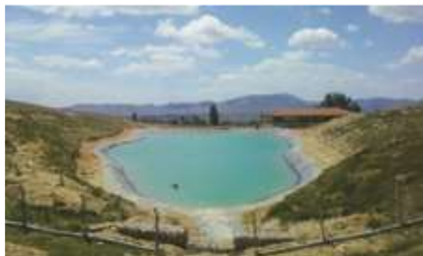
2009 - Eskisehir - Turecko - 5.700 m 2