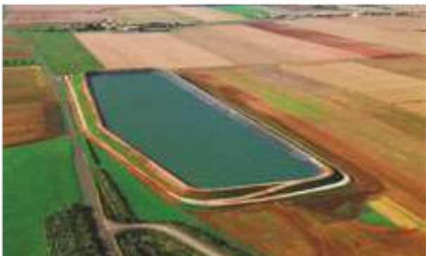
2006 - St Pierre le Vieux - Francie - 66.800 m 2