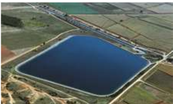
1994 - Sta Maria del Paramo - Španělsko - 118.000 m 2