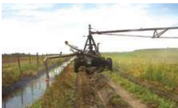
1994 - SCEA Cantegrit - Francie - 2 km