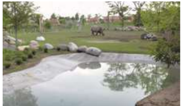
2005 - Toronto Zoo Rhino Pool - Kanada - 2.400 m 2