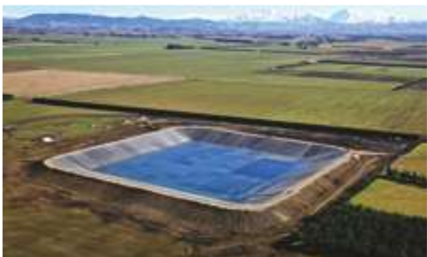
2009 - Turley Farm - Nový Zéland - 62.000 m 2